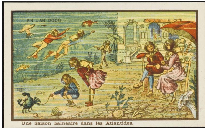
PIERRE SAUVAGEOT. Water music.